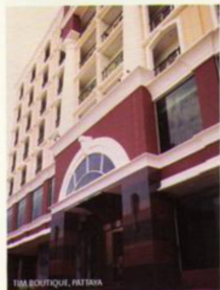
TIM BOUTIQUE, PATTAYA