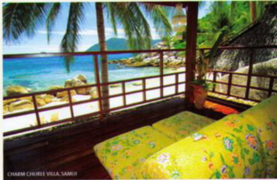
CHARM CHUREE VILLA, SAMUI