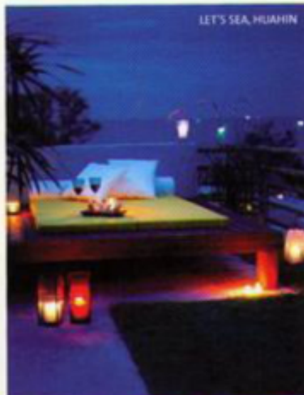
LET'S SEA, HUAHIN