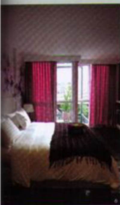
1.5 泰國傳統鬼神圖案壁紙的Green Room - 2.Blue Room 清新的藍色加上白色優雅的四柱床，恬適悠閒 - 3.Purple Room - 4.泰國地圖壁紙的Yellow Room - 5.7 層高牆壁壁紙、粉紅壁面的Pink Room -

顏色的靈活運用，在這兒，呈現出相當獨特的情調與特別的意涵，既時尚又舒適、既現代又潛藏傳統精神、既具設計感又浪漫寫意……Jane說，有一次從新加坡來的3個女孩，因為每間房間都各有特色，一直不知挑那一間來住，其中剛好有一位女孩過生日，她是星期一出生，因此Jane就建議住代表星期一的Yellow Room，讓這3位女孩的曼谷行別具意義。